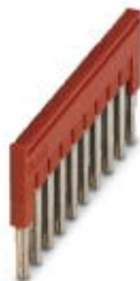
Steckbrücke, Rastermaß: 5,2 mm, Länge: 22,7 mm, Breite: 50,6 mm, Polzahl: 10, Farbe: rot

Bitte beachten Sie, dass die hier angegebenen Daten dem Online-Katalog entnommen sind. Die vollständigen Informationen und Daten entnehmen Sie bitte der Anwenderdokumentation. Es gelten die Allgemeinen Nutzungsbedingungen für Internet-Downloads. ( http://phoenixcontact.de/download )