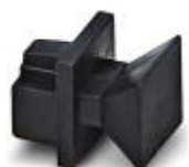
Staubschutzkappen für RJ45-Buchse

Staubschutz - FL RJ45 PROTECT CAP - 2832991