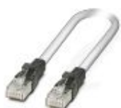
Patch-Kabel, CAT5, vorkonfektioniert, 5 m

Patch-Kabel - FL CAT5 PATCH 5,0 - 2832580