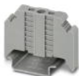
Endhalter, Breite: 9,5 mm, Farbe: grau