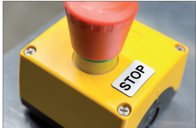
Paneelplaatjes, een uitstekend alternatief voor gegraveerde plaatjes.