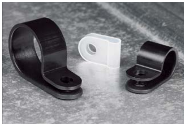
Die P-Clip Befestigungsschellen sind in verschiedenen Größen erhältlich.