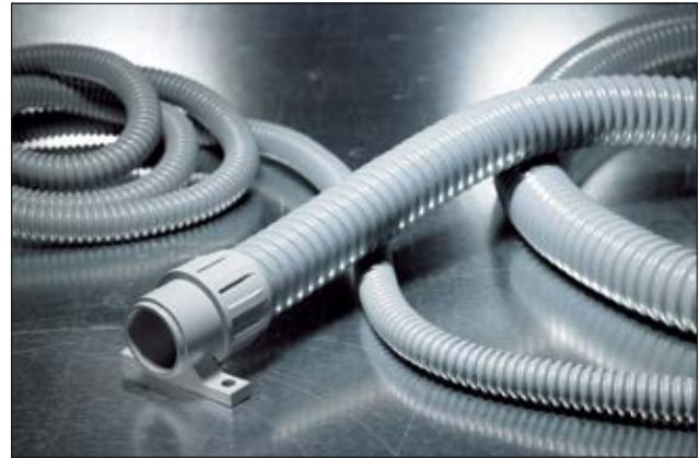
FlexiGuard FG mit Verschraubung FG-UH.