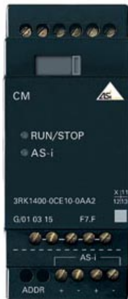
AS-INTERFACE FUNKTIONSMODUL LOGO! STANDARDSLAVE IP20 4DI/4DO