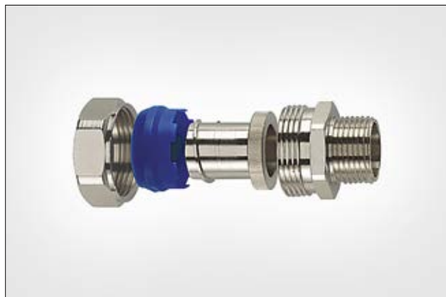
HeloGuard PCS-FMC starre Kompressionsverschraubung.